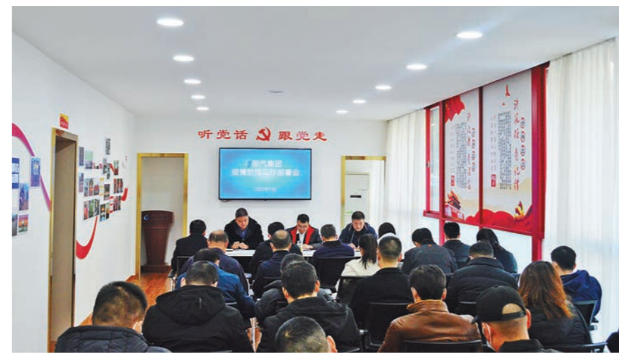
按照非必要不举办的原则,严格控制会议活动应当制定防控方案,提倡采取视频形式举行。

就贯彻上级疫情防控精神和丽汽集团下步疫情防控工作,集团党委书记、董事长黄伟君作出三点要求,一是意识上要紧起来,春节人员流动性增强,丽汽集团服务性单位,面对顾客群体多,另外对标丽汽集团刚刚获得的市抗击新冠肺炎疫情先进集体和基层党组织,更要从思想和行动上紧起来。二是行动上要快起来。对照省市要求,细化措施,要做好防疫物资准备,各单位特别是东站、安检站等窗口单位要提前做好应对,查漏补缺。三是纪律上要严起来。严明纪律,压实责任,一级